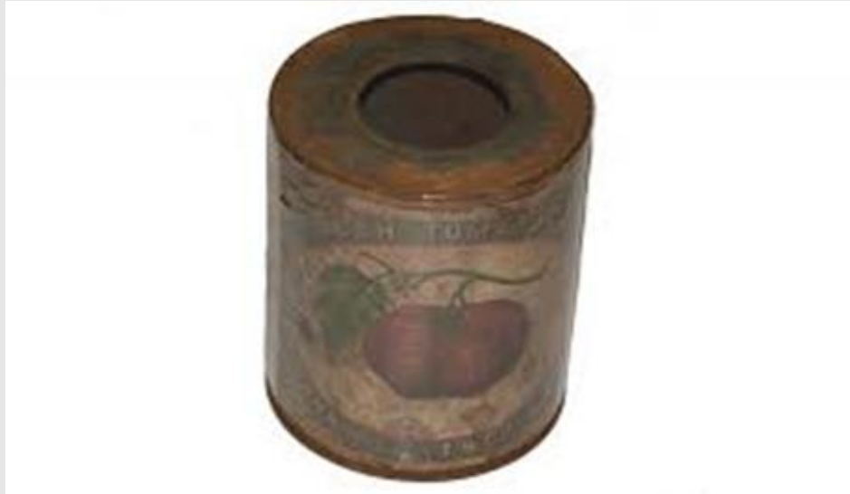
CIVIL WAR PERIOD TOMATO CAN WITH LABEL

A guerra civil americana provocou um grande avanço à indústria de latas. A produção de 5 milhões de latas anuais, saltou para 30 milhões ao fim do conflito, cinco anos após.