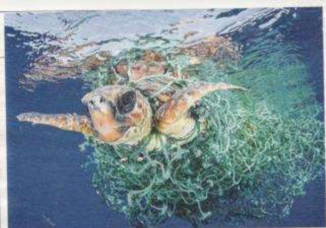
TRISTE DESTINO Tartaruga presa em rede nos mares da Espanha

Quanto ao artigo "Cadê a política externa?" (13 de março, escrito pelo diplomata Paulo Roberto de Almeida), cabe ressaltar que em momento al-