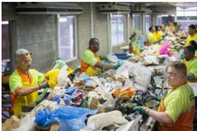
Reaproveitamento. Em São Paulo, central de triagem Carolina Maria de Jesus, na zona sul, tem potencial para separar até 250 toneladas por dia; hoje recebe de 100 a 120 toneladas/dia

SÃO PAULO - A estagnação das políticas públicas no setor dos resíduos sólidos provocou o aumento da quantidade de lixo enviado para locais inadequados em 2017. A volta dos lixões não apenas gera mais impactos ao ambiente e à saúde da população, como faz com que o País, ao também não incrementar a cadeia da reciclagem , desperdice oportunidades econômicas com o lixo.