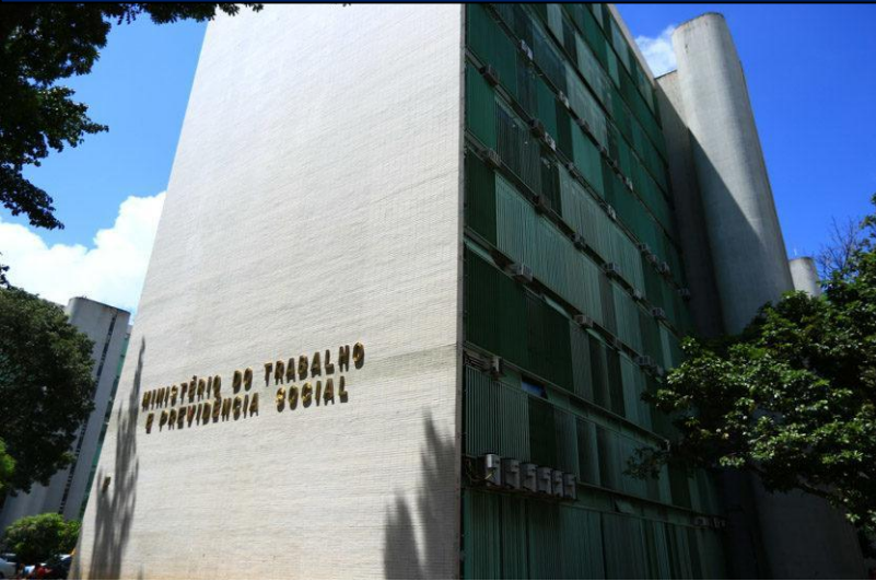
MINISTÉRIO DO TRABALHO – MTb