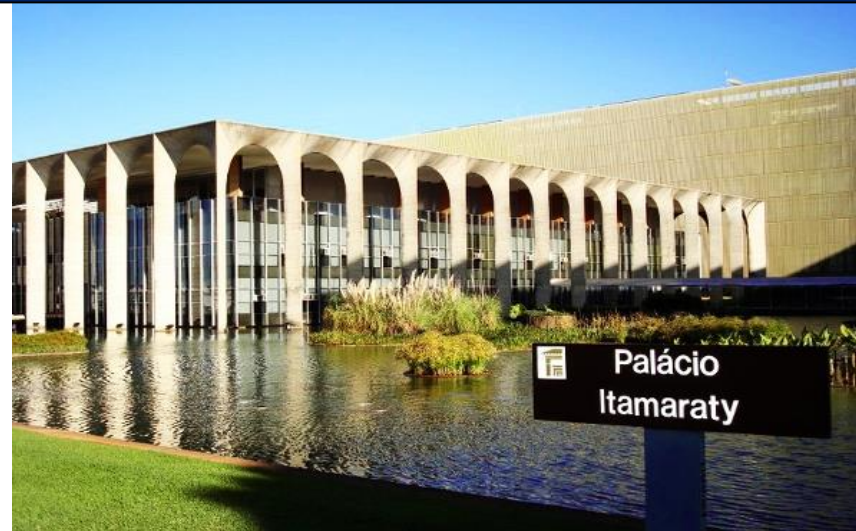
MINISTÉRIO DAS RELAÇÕES EXTERIORES – MRE