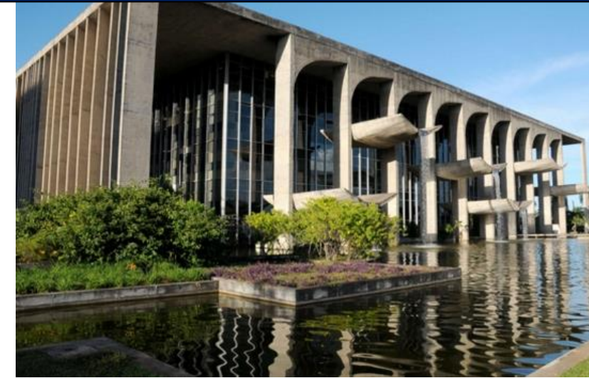
MINISTÉRIO DA JUSTIÇA & MINISTÉRIO EXTRAORDINÁRIO DA SEGURANÇA PÚBLICA / POLÍCIA FEDERAL