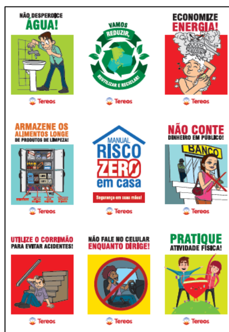
Cartela de adesivos distribuída

Manual Risco Zero em Casa, uma cartela de adesivos, redutores de vazão e um imã de geladeira.