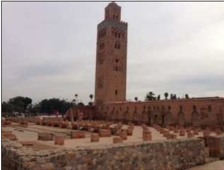
Mesquita La Koutoubia – Século VIII