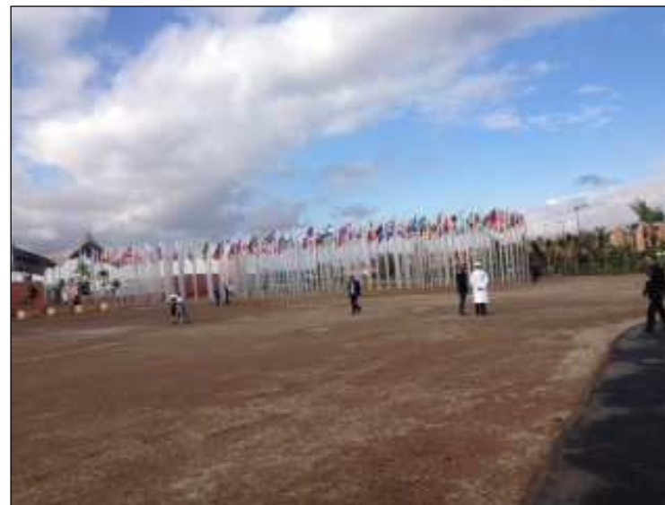
Entrada Principal da COP 22