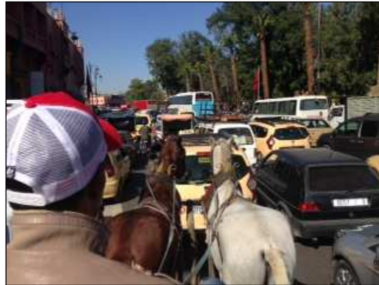
Convivência quase harmoniosa