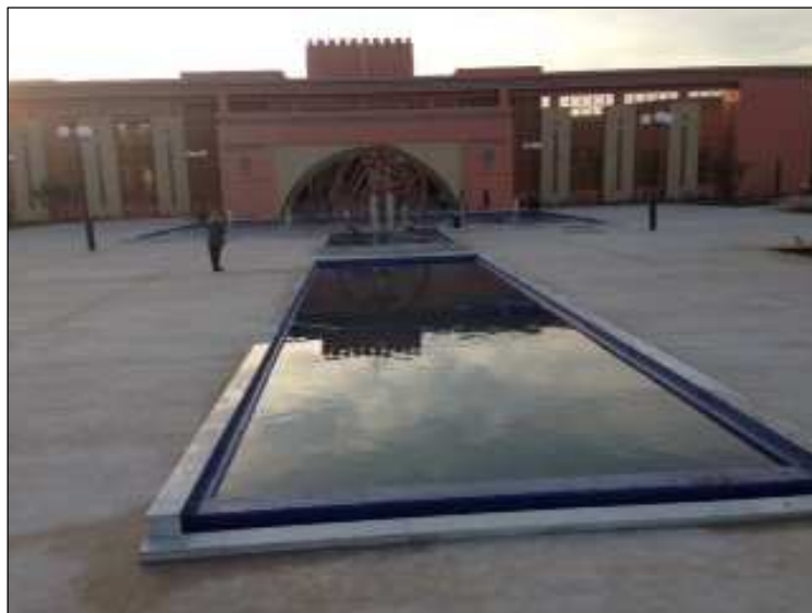
Museu da Água - Inauguração Dezembro 2016