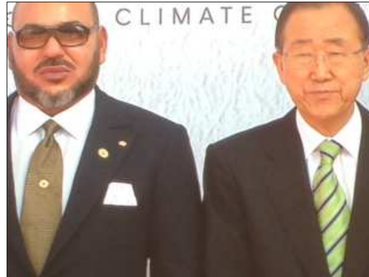
Mohammed VI - Ban Ki Moon