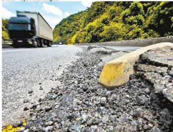
Régis Bittencourt, na altura do km 358, onde o veículo chega a trepidar por conta de ondulações