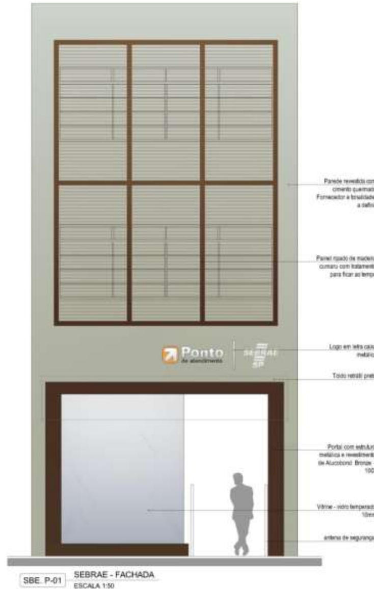
Perspectiva da Fachada