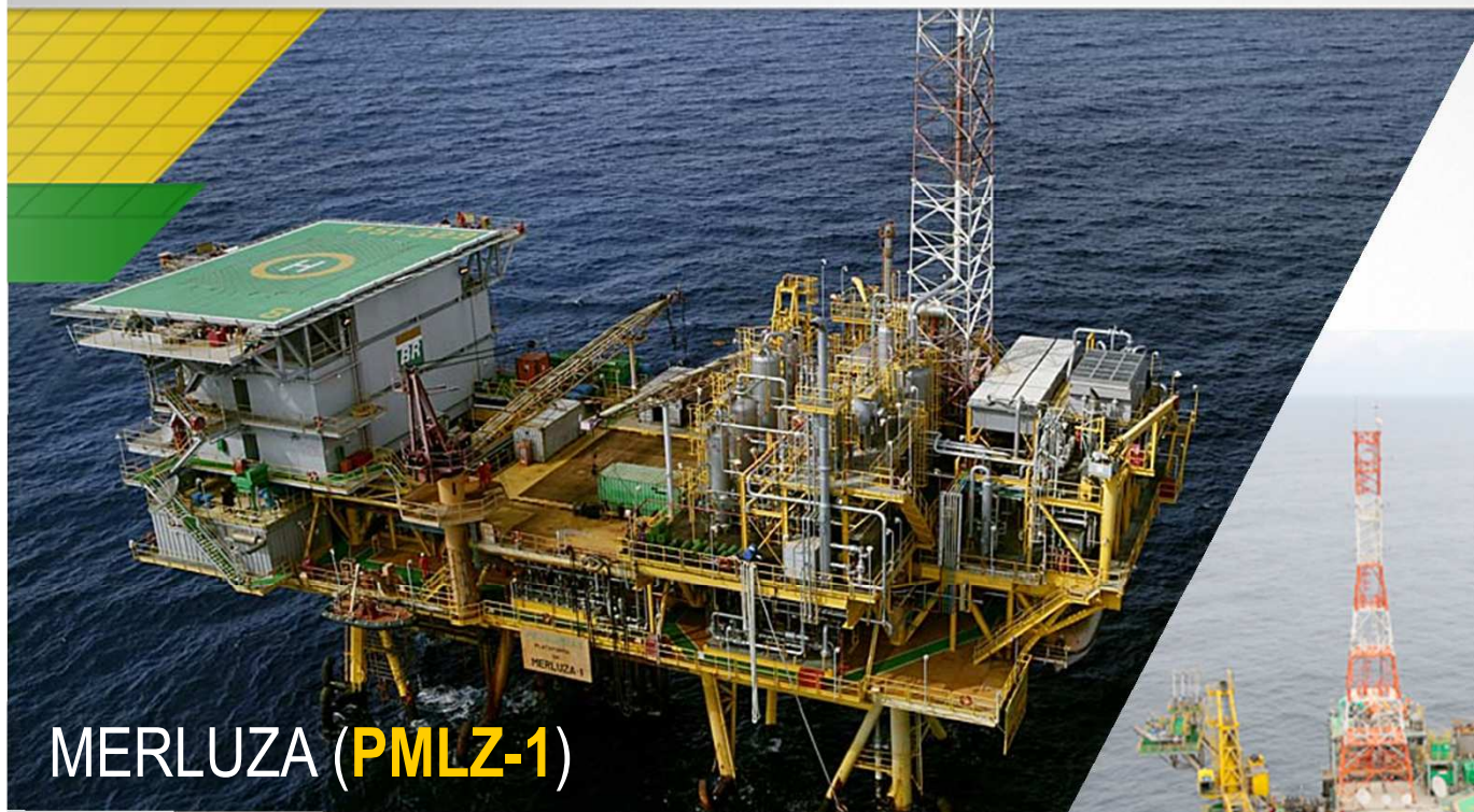
MERLUZA ( PMLZ-1 )