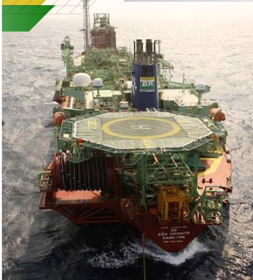
FPSO BW CIDADE DE SÃO VICENTE

Testes de Longa Duração e Sistemas de Produção Antecipada