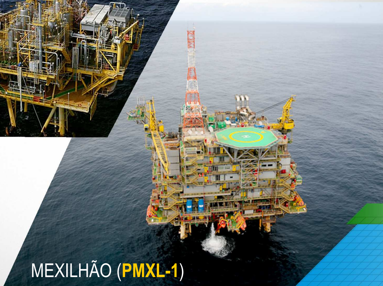
MEXILHÃO ( PMXL-1 )