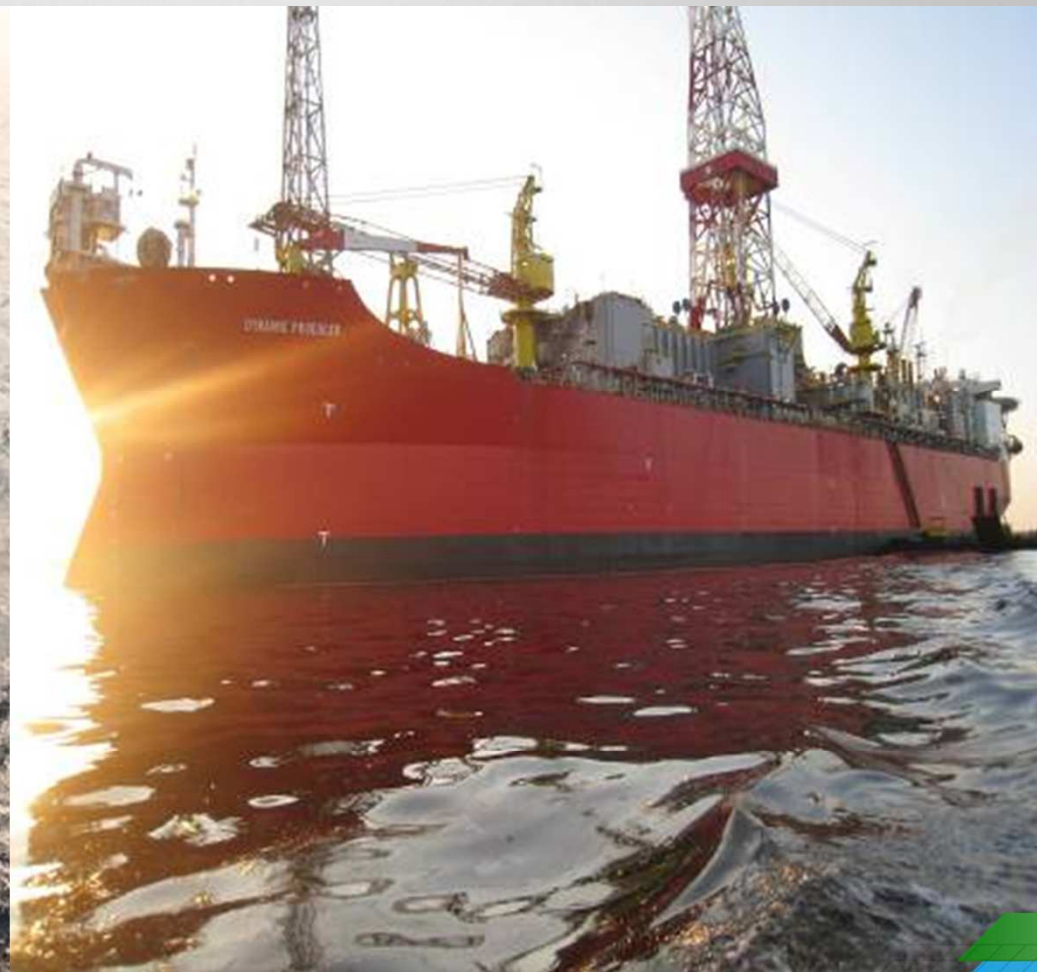
FPWSO DYNAMIC PRODUCER