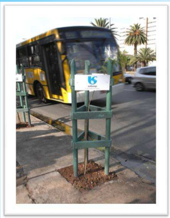
Av. Santos Dumont